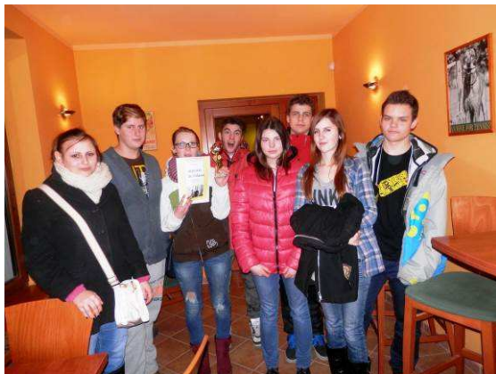
2. místo v turnaji v bowlingu