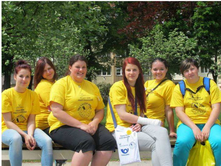
Charitativní sbírka Ligy proti rakovině