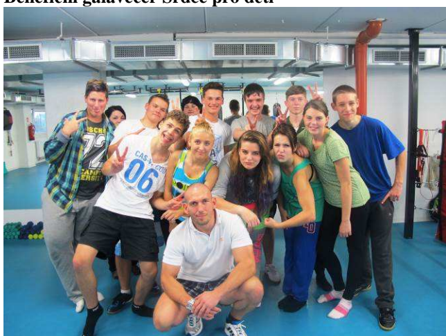
Exkurze do posilovny EVO