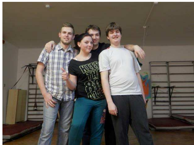
Taneční kroužek s panem vychovatelem