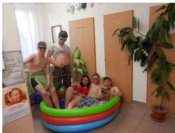
Slunce v duši :)