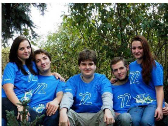
Projekt 72 hodin