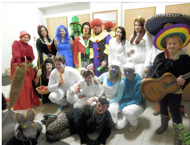
Pohádkový průvod za světélky