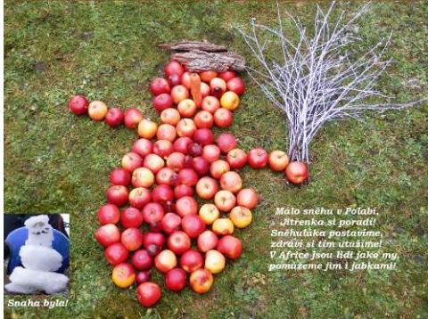
Projekt Sněhuláci pro Afriku