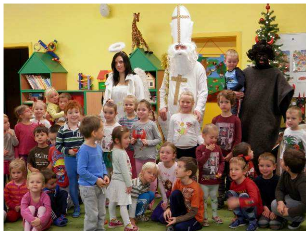
Mikuláš v Poděbradech