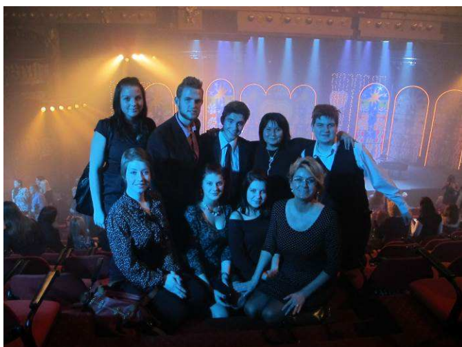
Benefiční galavečer Srdce pro děti