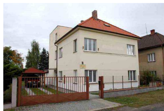
Domov mládeže Jitřenka - školní rok 2014/2015