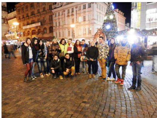
Vánoční výlet do Prahy