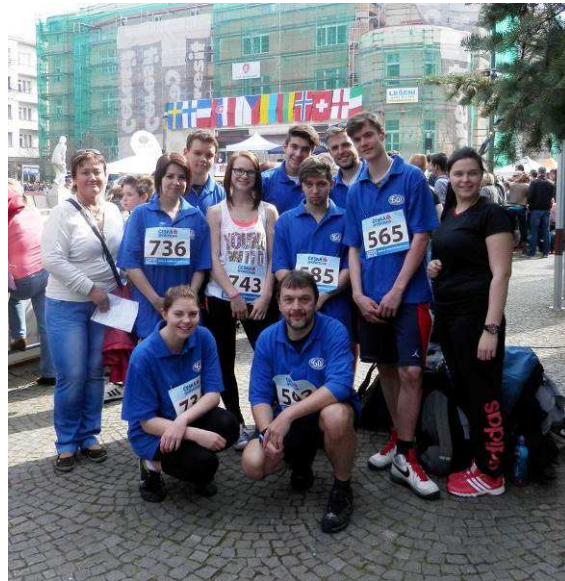
Běh starosty města Poděbrad – sportovní víkend