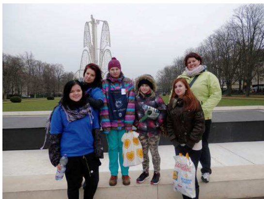
Zimní srdíčkové dny