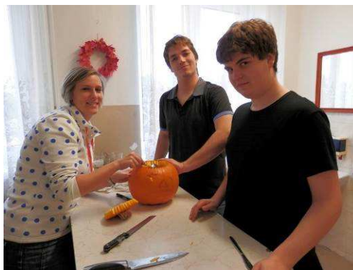
Halloween na Jitřence