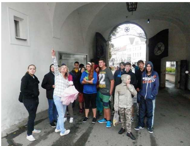
Prohlídka Poděbrad pro 1. ročníky