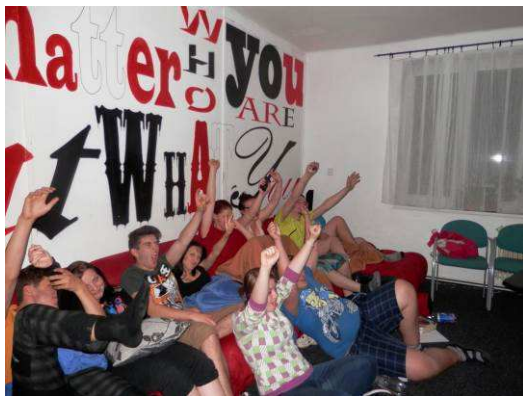
Fandíme MS v hokeji