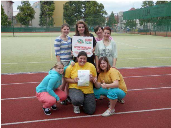
Turnaj ve vybíjené - 1.místo