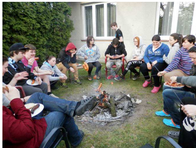
Čarodějnice na Jitřence