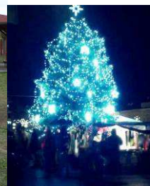
Vánoční besídka na Jitřence Návštěva slovenských studentů na Jitřence Rozsvícení stromku