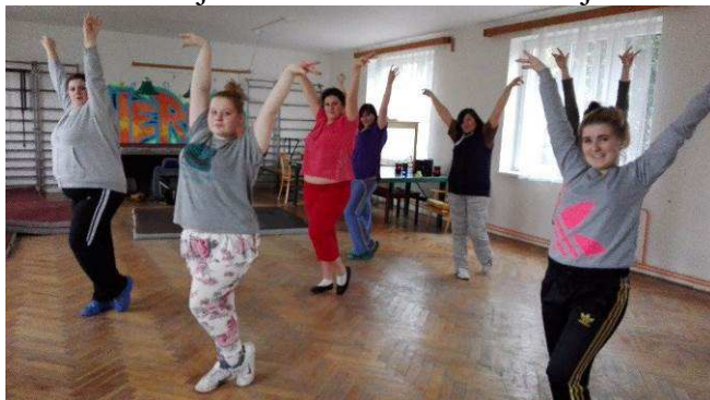
Zumba na Jitřence