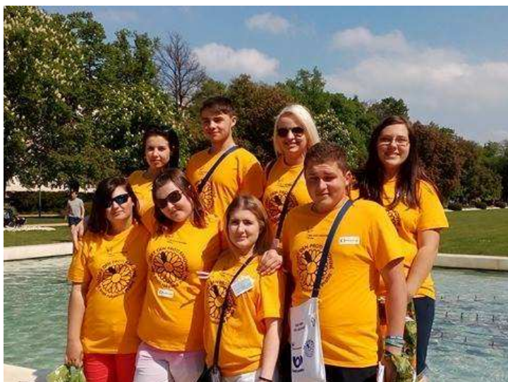
Charitativní sbírka Liga proti rakovině