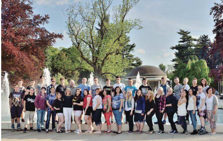
Domov mládeže Jitřenka - školní rok 2015/2016