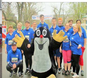
Sportovní víkend na Jitřence