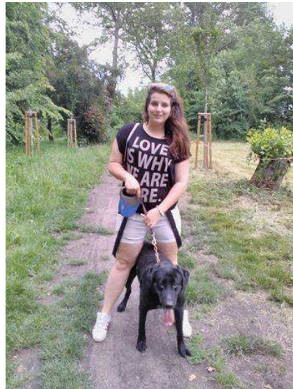
Spolupráce se psím útulkem