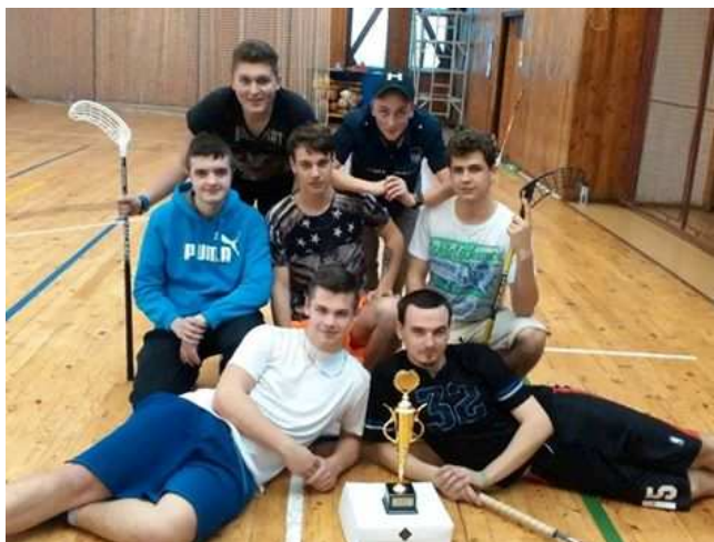
3. místo v krajském kole soutěže Turnaj ve florbalu – 2. Místo