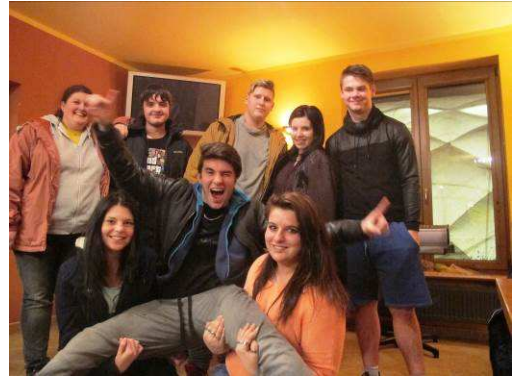
Turnaj domovů mládeže v bowlingu – 1.místo