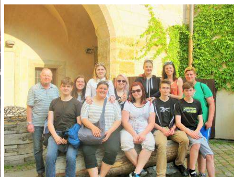
Neviditelná výstava v Praze