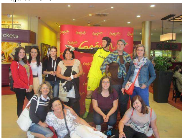
Jarní výlet do Prahy