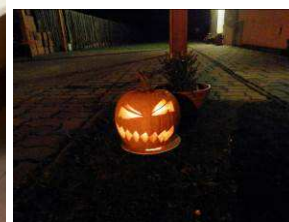
Halloween na Jitřence