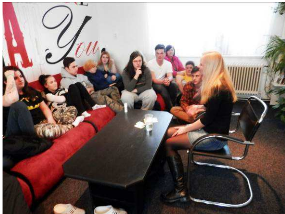
Beseda o zdravé výživě