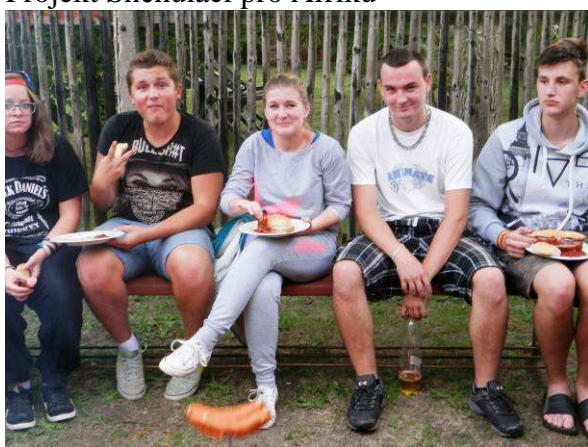
Posezení u táboráků