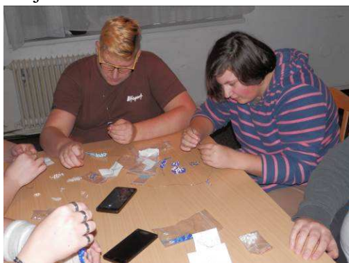
Výroba šperků z korálků