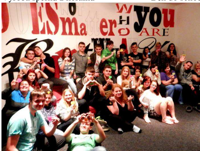
Charitativní sbírka Život dětem