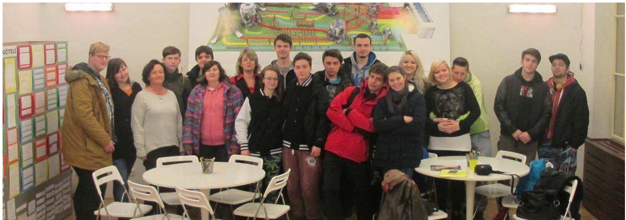
Protidrogový vlak – The revolution train