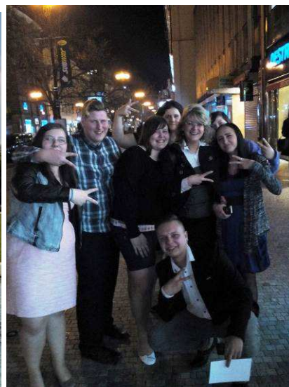
Muzikál Mýdlový princ v Praze