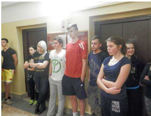
Běh do schodů – COP Nymburk