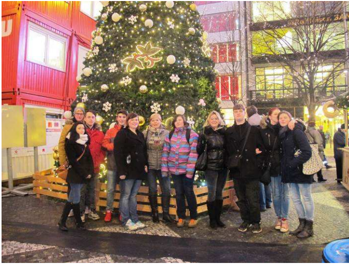
Vánoční výlet do Prahy