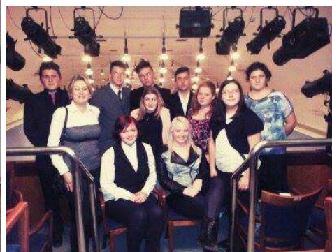
Koncert Prague Cello Quartet