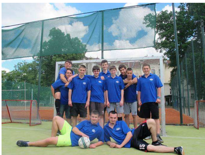
Turnaj chlapců v kopané – 2. místo