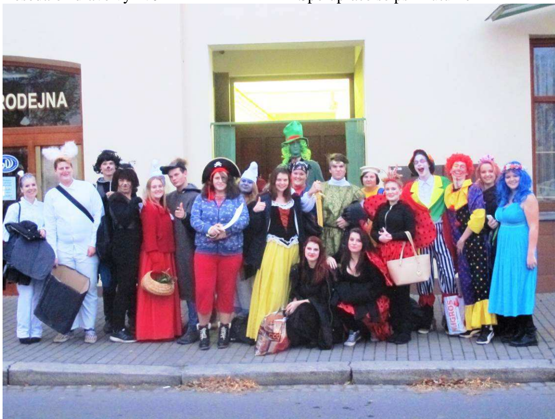
Průvod za světélky