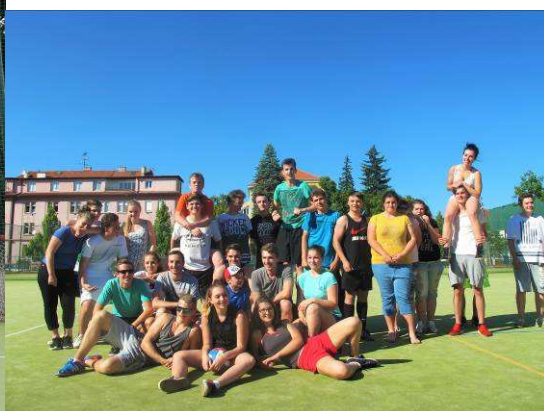
Vybíjená s hotelovkou