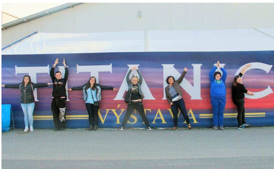
Výstava Titanic Praha – vítězná fotografie v soutěži