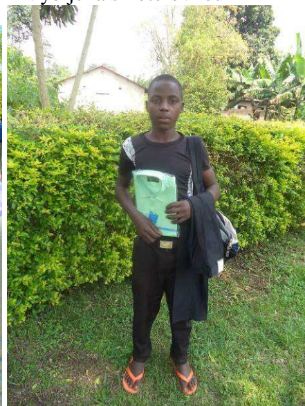
Projekt Světlo pro Ugandu