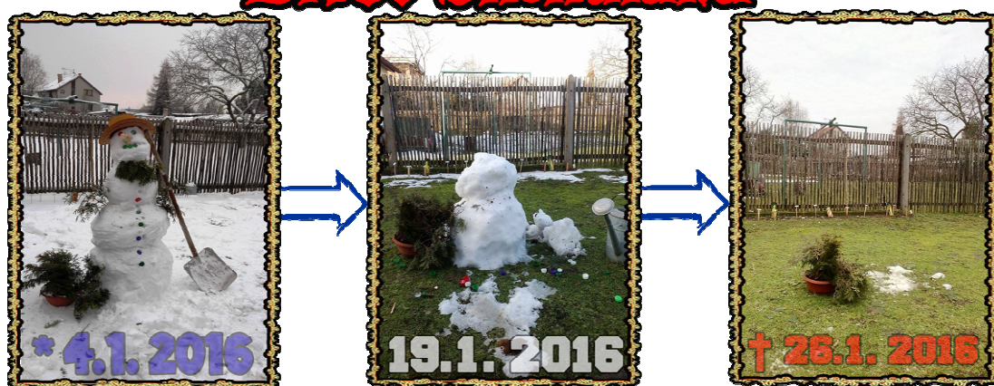
Projekt Sněhuláci pro Afriku