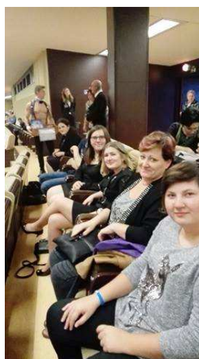
MUZIKÁL MAMMA MIA!