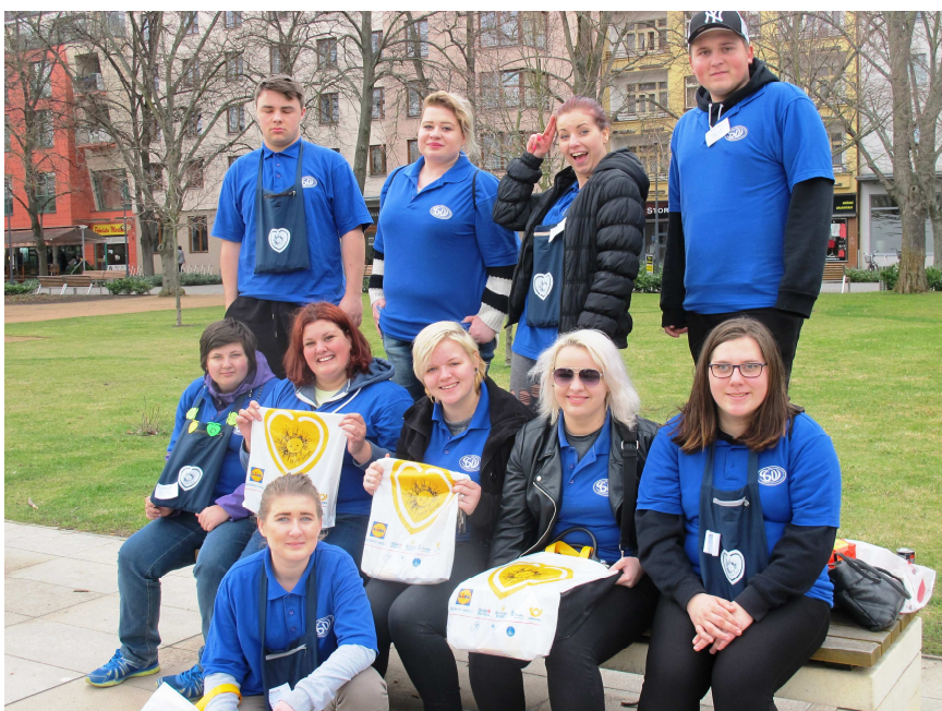
CHARITATIVNÍ SBÍRKA ŽIVOT DĚTEM