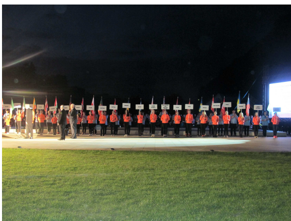
DOBROVOLNICKÉ AKTIVITY – EVROPSKÝ POHÁR V CHŮZI