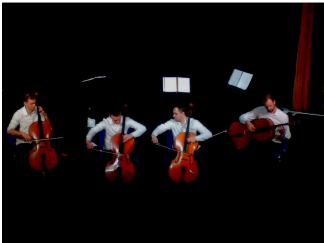
KONCERT PRAQUE CELLO QUARTET – DIVADLO NA KOVÁRNĚ