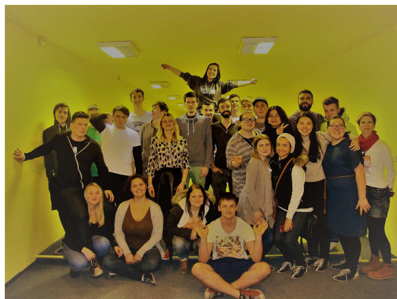
TURNAJ V BOWLINGU – SPOLEČNĚ SE ZAHRANIČNÍMI LEKTORY