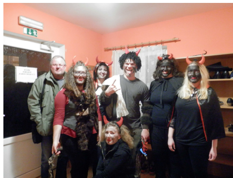
ČERTOVSKÁ ZÁBAVA V DĚTENICÍCH