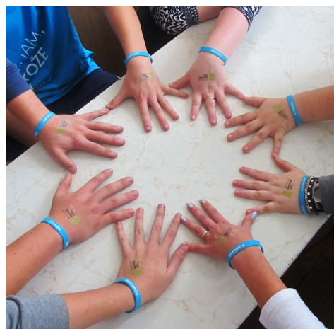
PROJEKT 72 HODIN