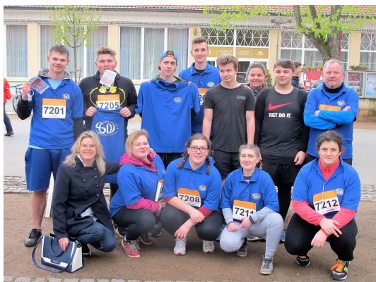
BĚH STAROSTY MĚSTA PODĚBRAD