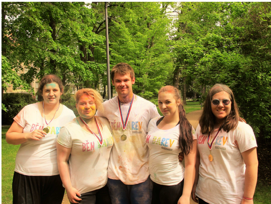
BĚH BAREV V PODĚBRADECH