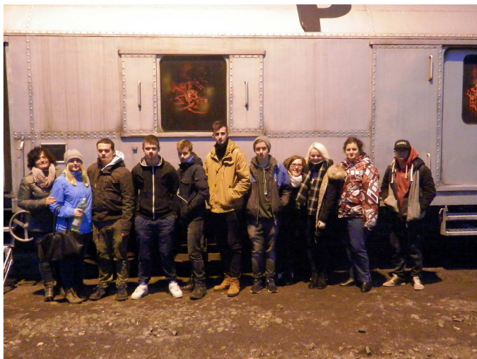
PROTI DROGOVÝ VLAK – PRAHA DEJVICE – THE REVOLUTION TRAIN