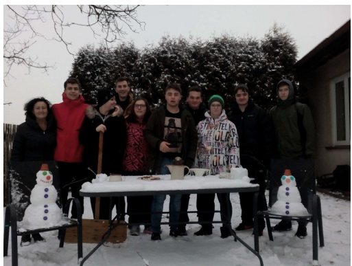
PROJEKT SNĚHULÁČI PRO AFRIKU