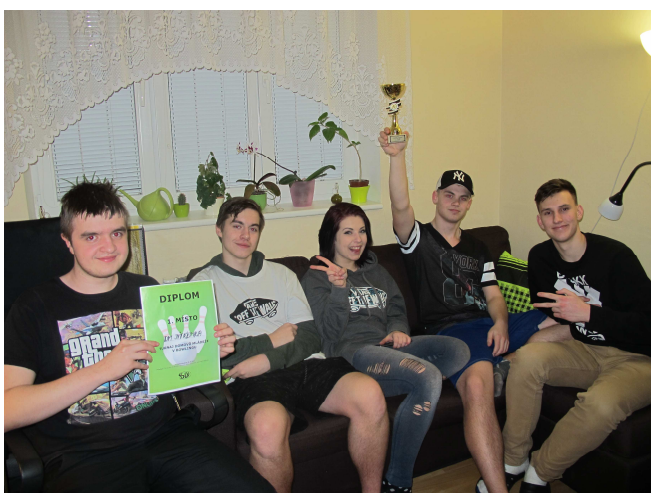
TURNAJ DOMOVŮ MLÁDEŽE – 1. MÍSTO V BOWLINGU