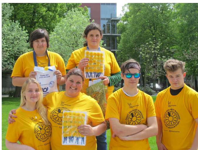
CHARITATIVNÍ SBÍRKA LIGA PROTI RAKOVINĚ