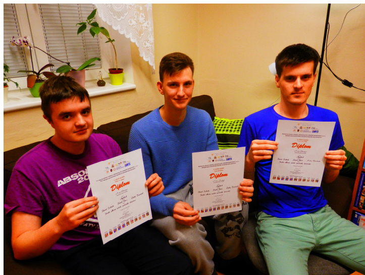
1. MÍSTO V OKRESNÍM KOLE SOUTĚŽE TUTA VIA VITAE