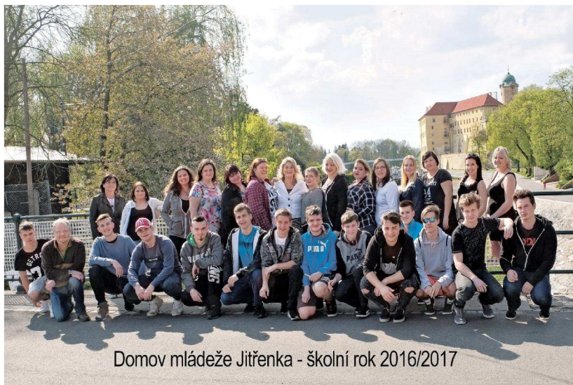
Domov mládeže Jitřenka - školní rok 2016/2017