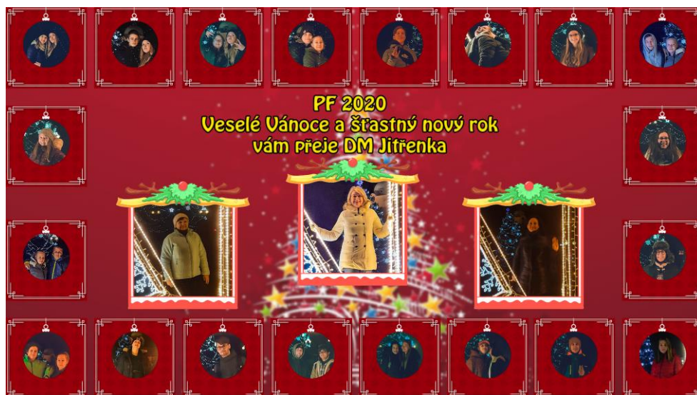
NAŠE PF 2020