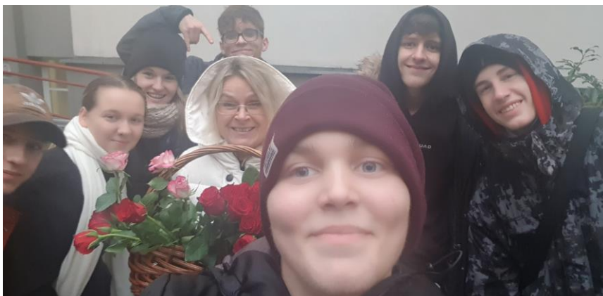
LASKAVCI V DOMOVĚ DŮCHODCŮ V LUXORU