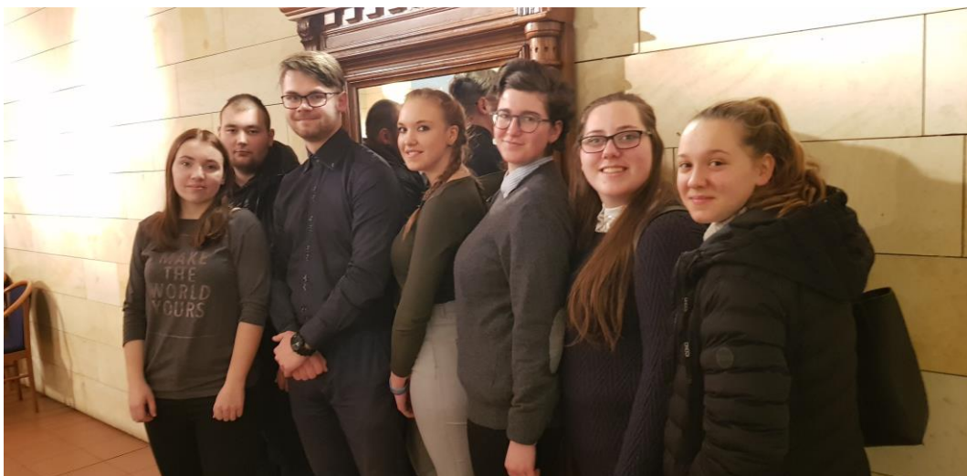
KONCERT PRAQUE CELLO QUARTET