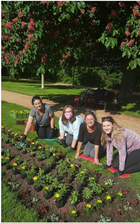
DOBROVOLNICKÉ AKTIVITY – SÁZENÍ LETNIČEK V PARKU