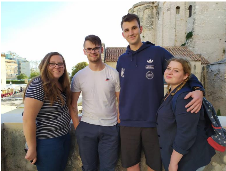
NAŠI DOBROVOLNÍCI V CHORVATSKU