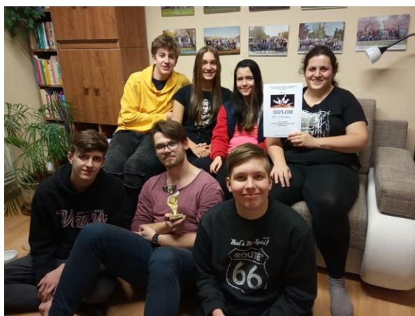
TURNAJE V BOWLINGU