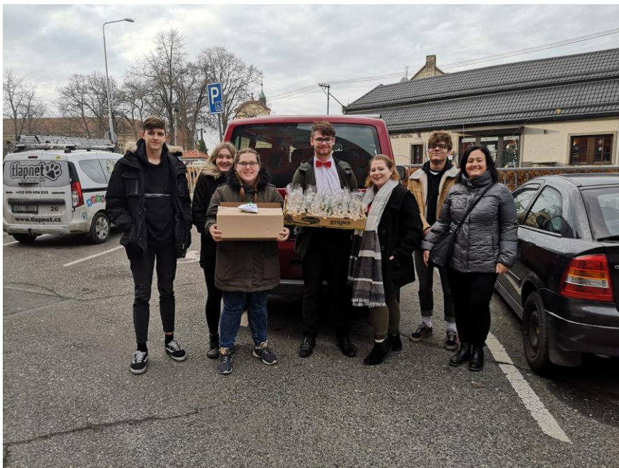
JEŽÍŠKOVA VNOUČATA V DOMOVĚ DŮCHODCŮ V ČÁSLAVI