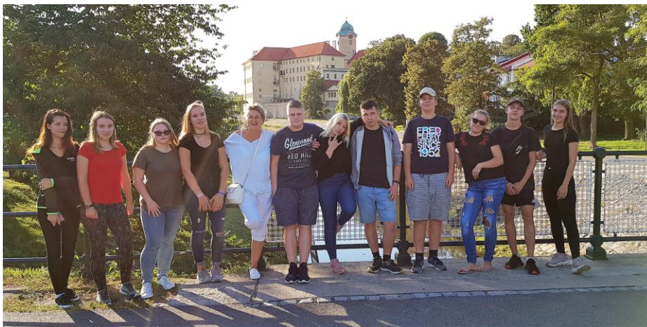
PROCHÁZKA PO PODĚBRADECH