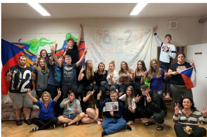
30 LET OD SAMETOVÉ REVOLUCE