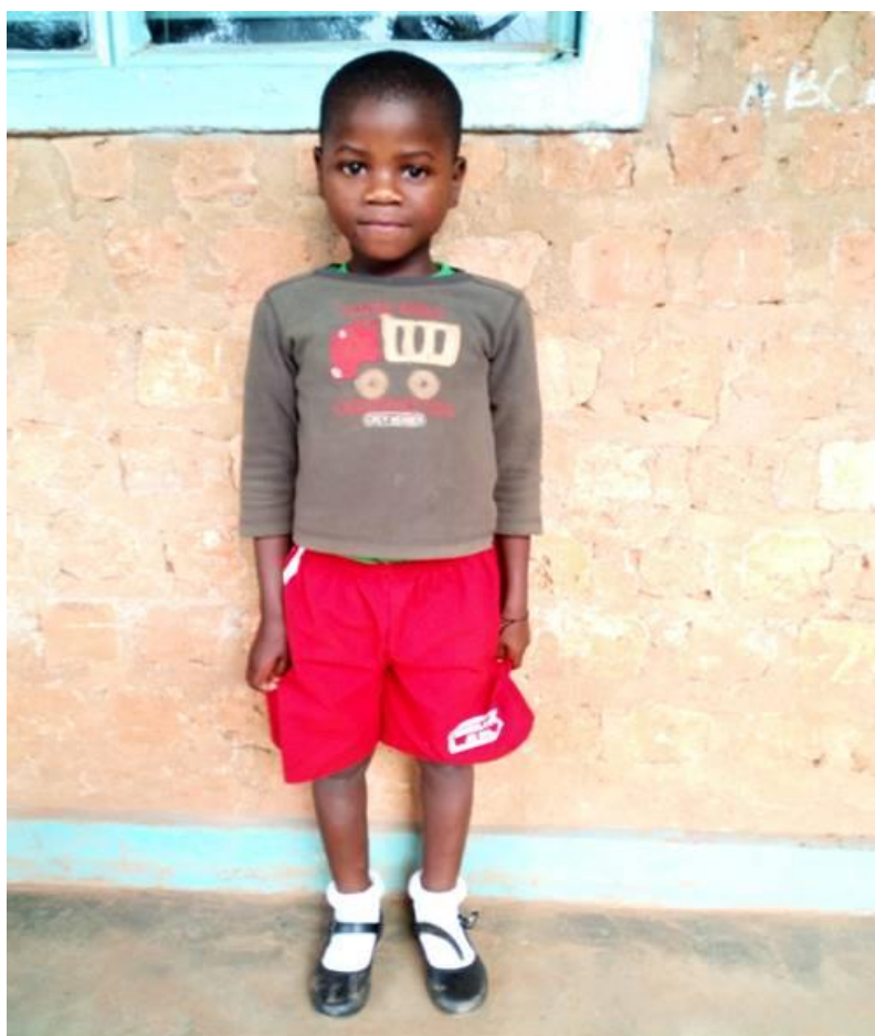
NAŠE NOVĚ ADOPTOVANÁ HOLČIČKA MASTULLA