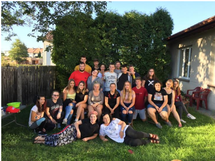
POSEZENÍ U OHNĚ NA ZAHRADĚ