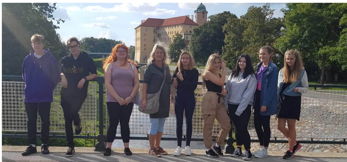
PROHLÍDKA PODĚBRAD PRO 1. ROČNÍKY