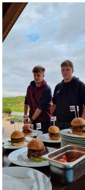
KURZ PŘÍPRAVY HAMBURGERŮ