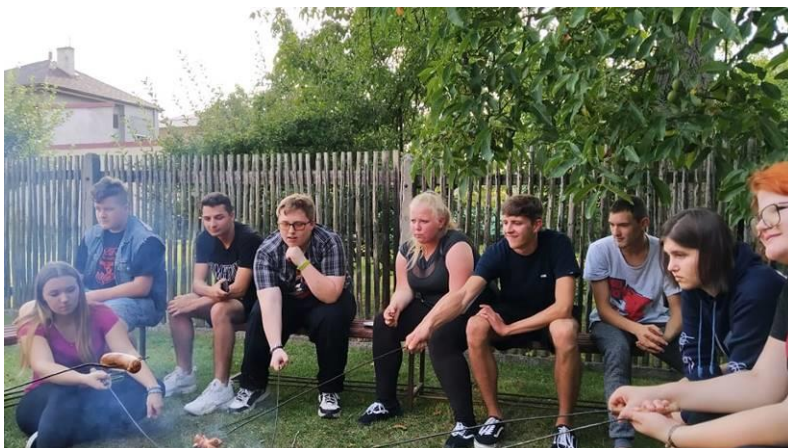
TRADIČNÍ ZAHÁJENÍ ŠKOLNÍHO ROKU U OHNĚ