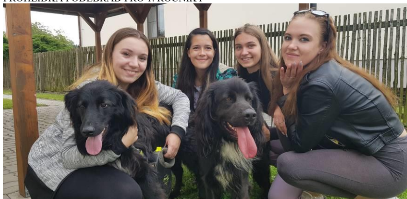
VENČÍME PEJSKY Z PODĚBRADSKÉHO ÚTULKU HARYK