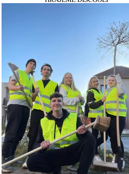
ČISTÍME PODĚBRADSKÉ CHODNÍKY – BRIGÁDA TSMP