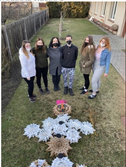
SNĚHULÁČI PRO AFRIKU