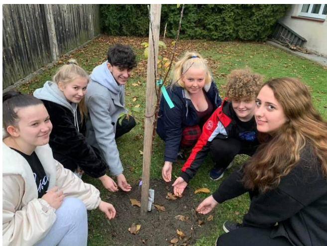
VÝSADBA CIBULEK – PROJEKT KROKU