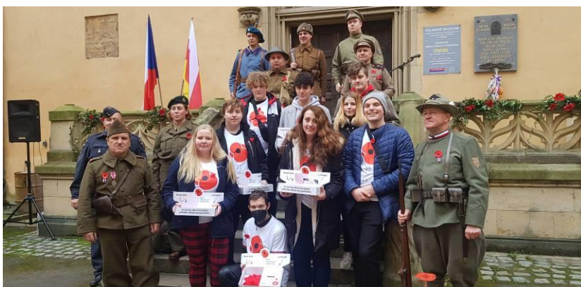
POPRVÉ ZORGANIZOVANÁ SBÍRKA VLČÍ MAKY