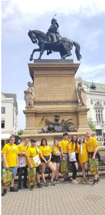
SBÍRKA LIGA PROTI RAKOVINĚ