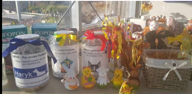
MALUJEME VELIKONOČNÍ VAJÍČKA PRO PEJSKY A KOČKY