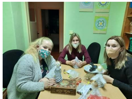
ŠABLONY II – PLETENÍ Z PAPIRU