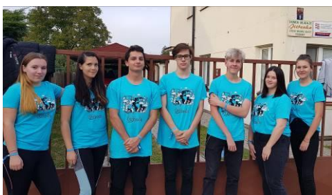
PROJEKT 72 HODIN – UKLÍZÍME BAŽANTNICI