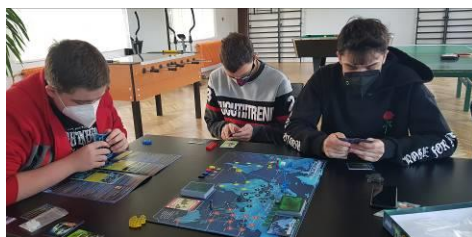
ŠABLONY II – KLUB SPOLEČENSKÝCH HER