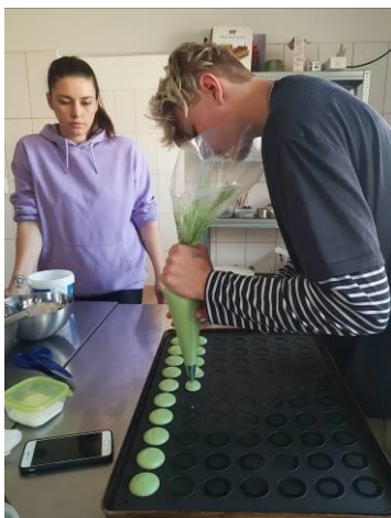
KURZ MAKRONEK – GRANT NROS