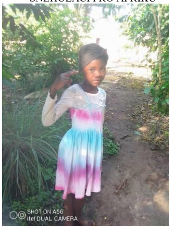
NAŠE ADOPTOVANÁ HOLČÍČKA MASTULLA JE STÁLE SOUČÁSTÍ NAŠÍ VELKÉ RODINY